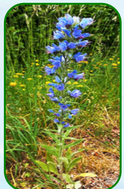
De magnifiques plantes réapparaissent dès qu'on laisse faire la Nature... !