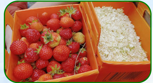
Les enfants des écoles font une belle récolte de fraises et fleurs de sureau